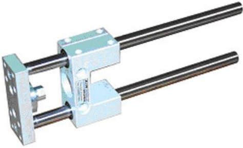
C-geleiding bouwt kort in

De H (en C) geleidingen hebben als functie (zijdelingse) krachten op te vangen en zo een cilinder te ontlasten en een goed geleide lineaire beweging te geven.