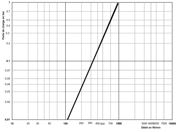
drukval tabel ASI06